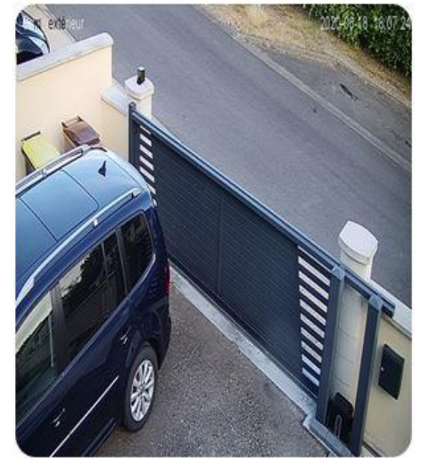
Watch Megapixel camera in France, Issy-Les-Moulineaux

Un exemple de caméras connectées mal protégées, disponibles directement sur Internet